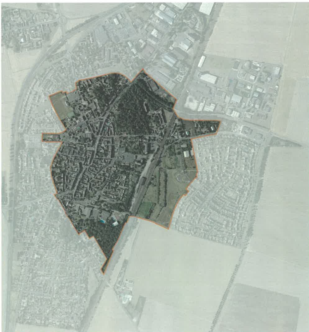
Carte du périmètre de l’Opération de Revitalisation de Territoire d’Angerville