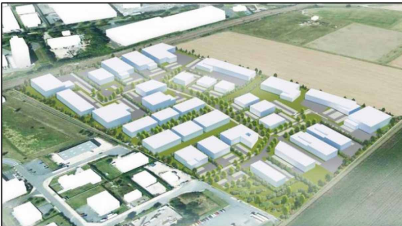
Figure 6 : Vue de l'insertion paysagère du bâti - Source EI p. 6

Selon l'étude d'impact (p. 23), « il sera mis en place une lisière périphérique arbustive et arborée. Visuellement cela formera un cadre végétal pour le secteur construit en transition avec le milieu agricole ».