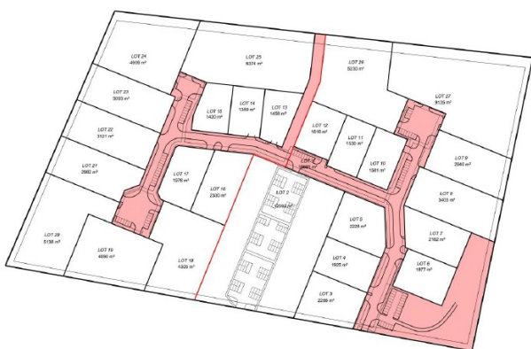
Figure 5 : Principe d'aménagement du secteur des Terres Noires. En rose le lot 1 commun aux deux tranches d'aménagement.

Les travaux auront lieu en deux phases, sans qu'une date prévisionnelle de début des travaux ne soit indiquée :