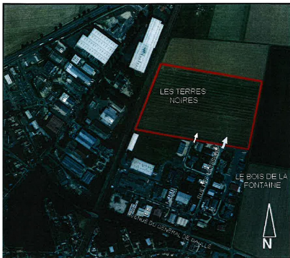
État actuel du site d'aménagement (demande de permis d'aménager, p. 7)