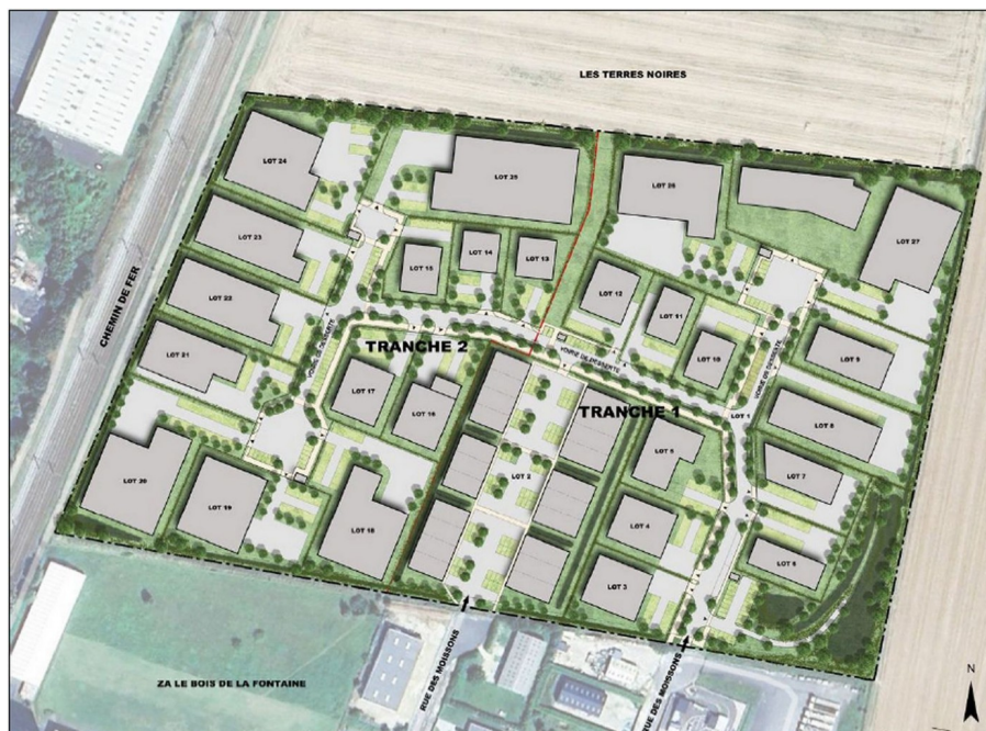
Figure 4 : Principe de phasage pour l'aménagement du secteur des Terres Noires (EI, p.39)

Il est prévu que cette extension comprenne 27 parcelles modulables (de 1 300 à 12 000 m 2 ), pour une surface de plancher totale équivalant à 35 000 m 2 (31 500 m 2 dans le résumé non technique, p. 23). Elle est destinée à des TPE (très petites entreprises, de 1 300 à 2 400 m 2 ), PME (petites et moyennes entreprises, de 2400 à 5 400 m 2 ), activité industrielle et village d'entreprises, ainsi qu'à l'aménagement d'espaces verts, regroupés dans un lot commun. Le lot commun inclut la création de voiries de desserte, de réseaux de distribution et d'assainissement, d'un parking de covoiturage, d'aires d'infiltration paysagées et de noues de rétention et d'infiltration.