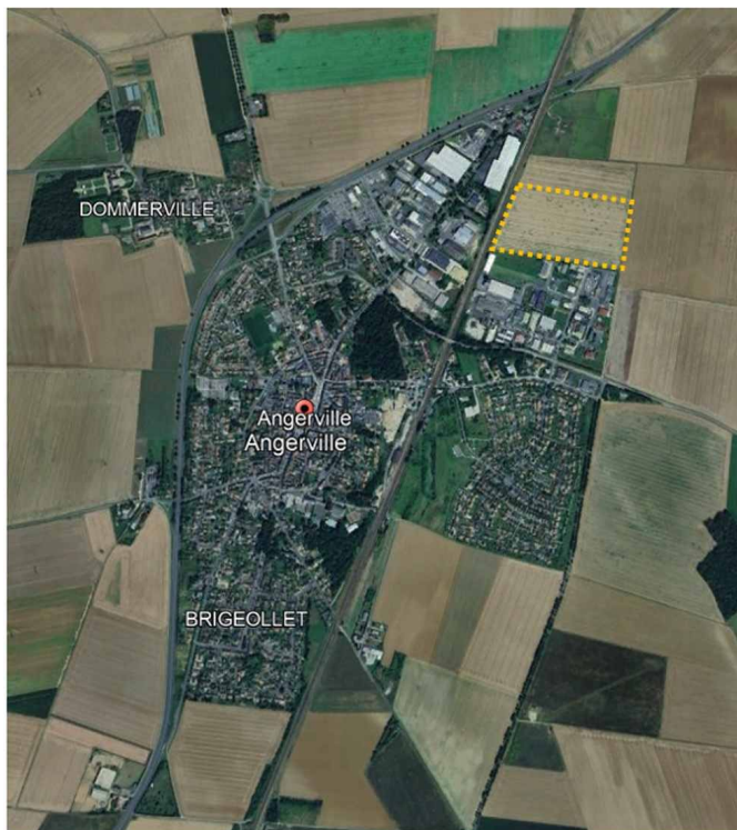
Figure 2 : Limites approximatives du site des Terres noires (pointillé orange MRAe) sur photo aérienne Google Earth

Située dans le département de l'Essonne, la commune d'Angerville est localisée à 66 km au sud-ouest de Paris et à 20 km au sud-ouest d'Étampes. Elle s'étend sur 2 580 ha et compte 4 395 habitants (Insee 2021). Elle fait partie de la communauté d'agglomération de l'Étampois Sud Essonne (CAESE), qui regroupe 37 communes et compte 55 662 habitants (Insee 2021).