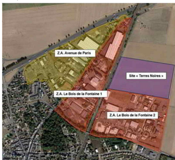
Figure 3 : L'extension envisagée de la zone du Bois de la Fontaine

Située dans le département de l'Essonne, la commune d'Angerville est localisée à 66 km au sud-ouest de Paris et à 20 km au sud-ouest d'Étampes. Elle s'étend sur 2 580 ha et compte 4 395 habitants (Insee 2021). Elle fait partie de la communauté d'agglomération de l'Étampois Sud Essonne (CAESE), qui regroupe 37 communes et compte 55 662 habitants (Insee 2021).